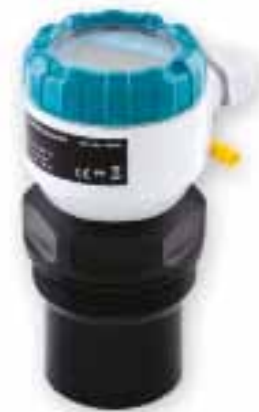
Ultraschall Sensor US-20