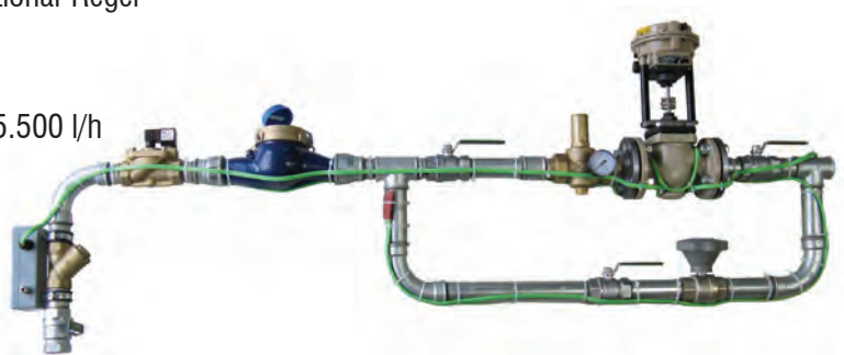
Wasserdosiereinheit mit elektro-pneumatischem Ventil WD - fertig verrohrt