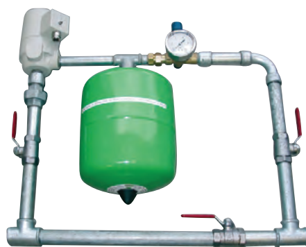
Unité de dosage d'eau avec valve à impulsion DEW 2500/1-2